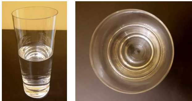
Figura 4 Visões, inclinada e de topo em relação à mesa, de um copo de base circular